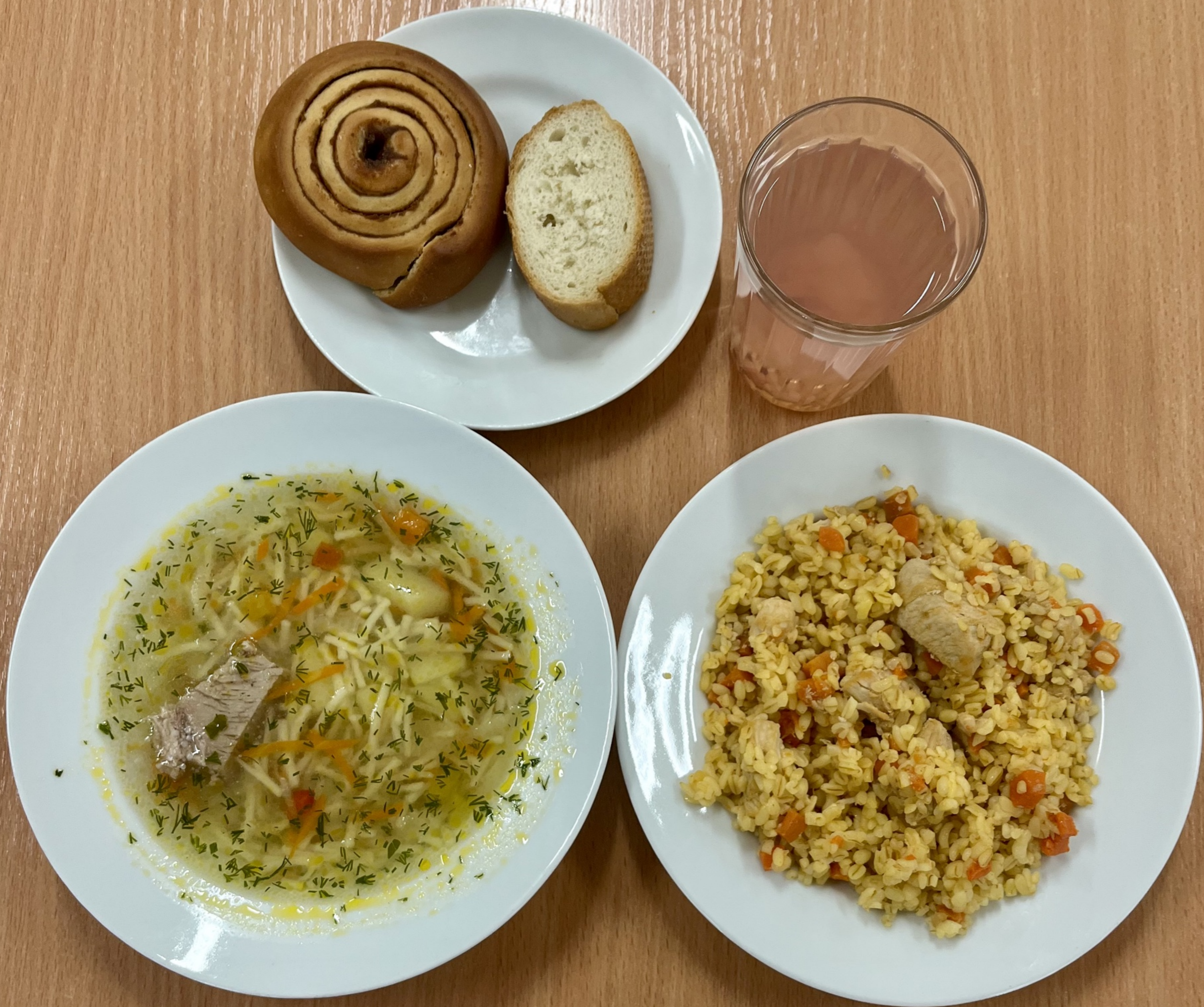
Бесплатное питание (обед) 1-4 класс (2 смена)