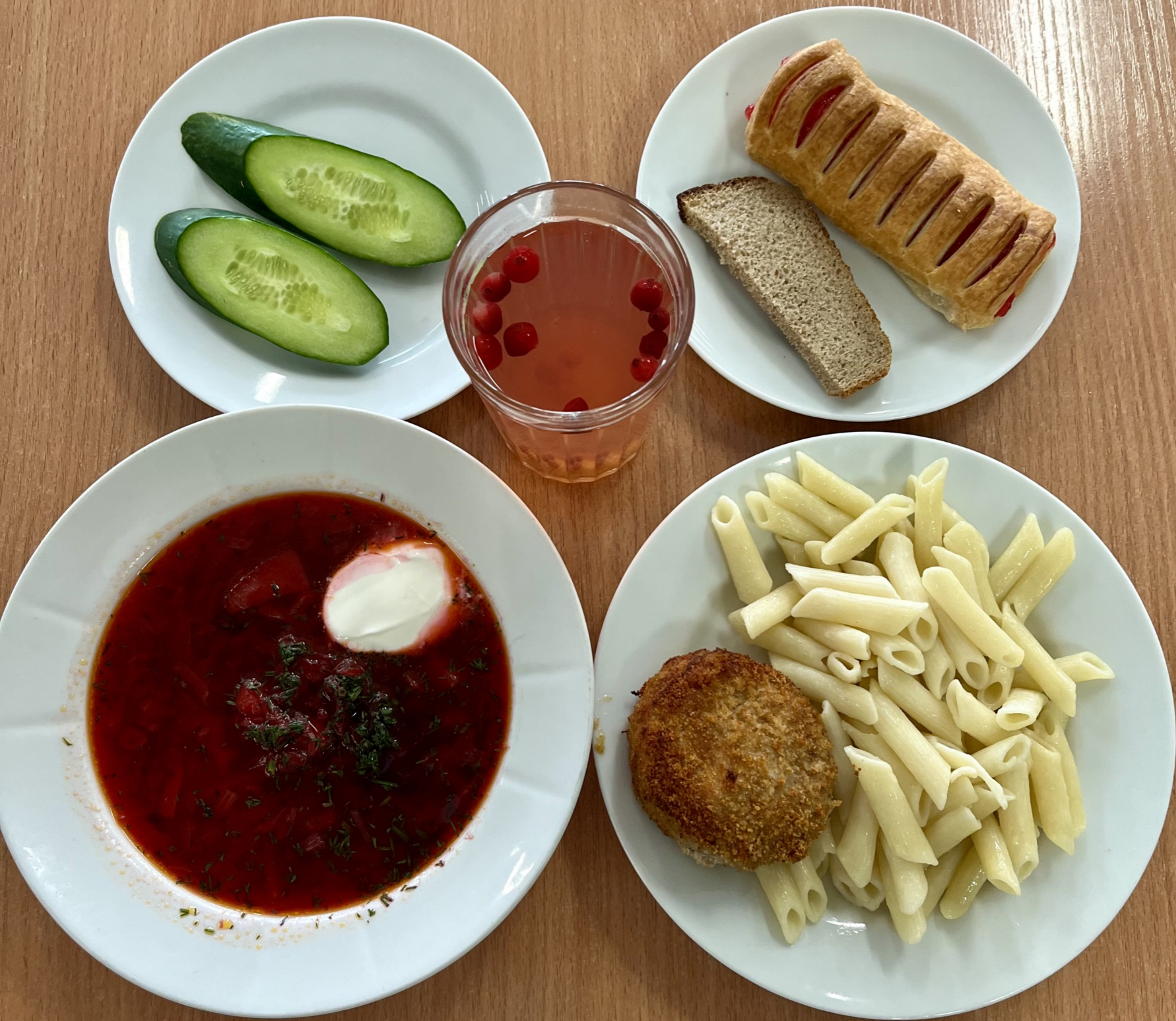
Бесплатное питание (обед) 1-4 класс (2 смена)