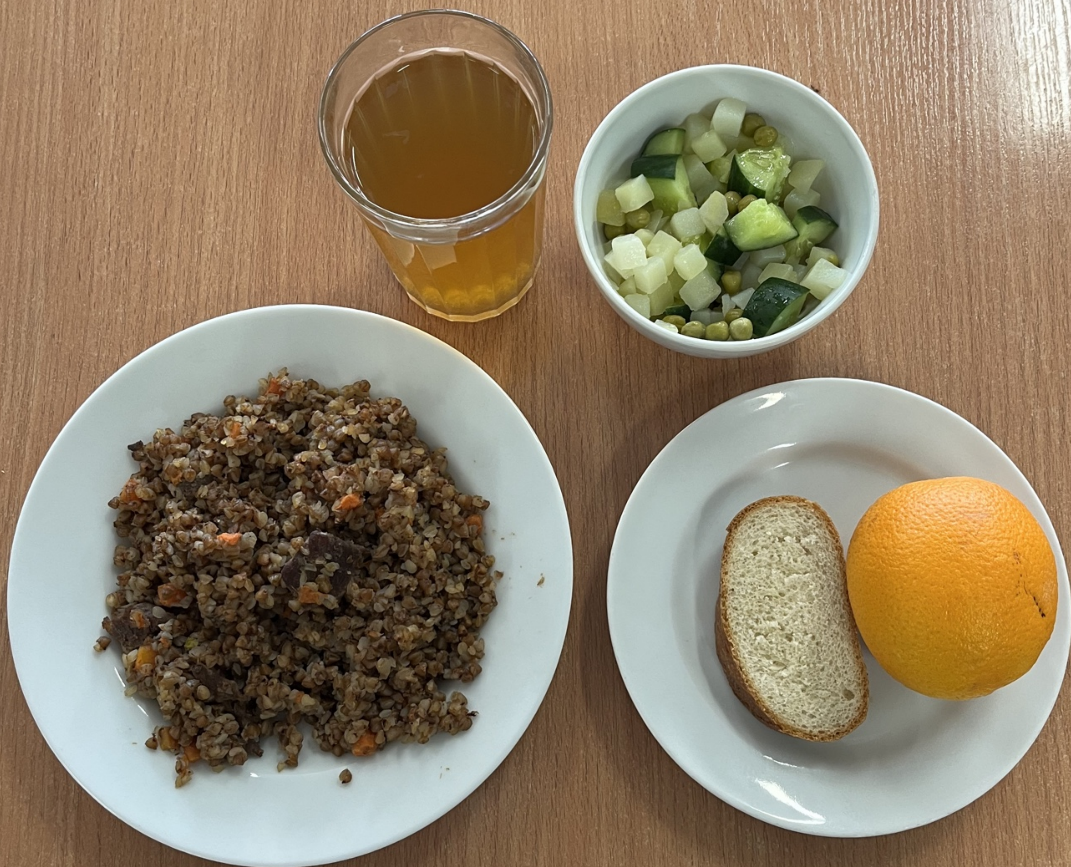
Льготная категория (завтрак) 5-11 классы (1 смена)